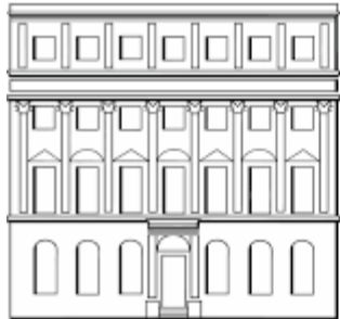
German Historical Institute London