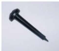
Stanzer für Multi-Auslass-Tropfer (EM6-M101) und SXB-360-025 Micro-Sprüher (13-16 mm Rohre)