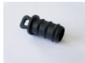
Endstopfen für 13-16 mm Rohre