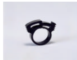
Schelle für 13-16 mm Rohre